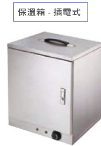
保溫箱 - 插電式